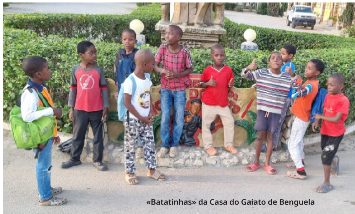
«Batatinhas» da Casa do Gaiato de Benguela