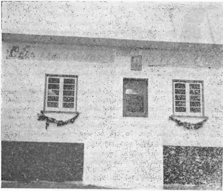
Uma das lindas Casas na Lourinhã!

Há meses fui em jornada desgostosa bater à porta de paróquias onde havia meios de construir e não se construía. Há delas neste mundo de Cristo. Ainda as há, por nosso mal.