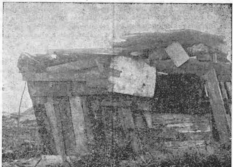
Monsanto — Lisboa: património de Pobres