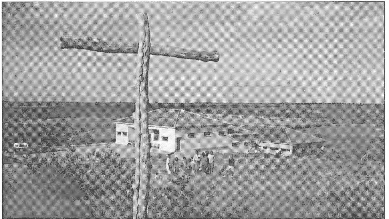
Casa do Gaiato de Maputo. A cruz domina.