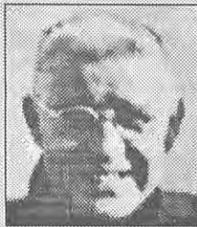
A Crisandade adormeceu...